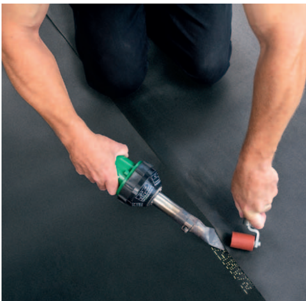
Der Heißluftföhn bietet sich für An- und Abschlüsse und die Integration von Formteilen an.