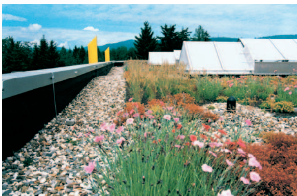
Für Gründächer ist die Produktvariante NOVOPROOF® DA-P im Programm.