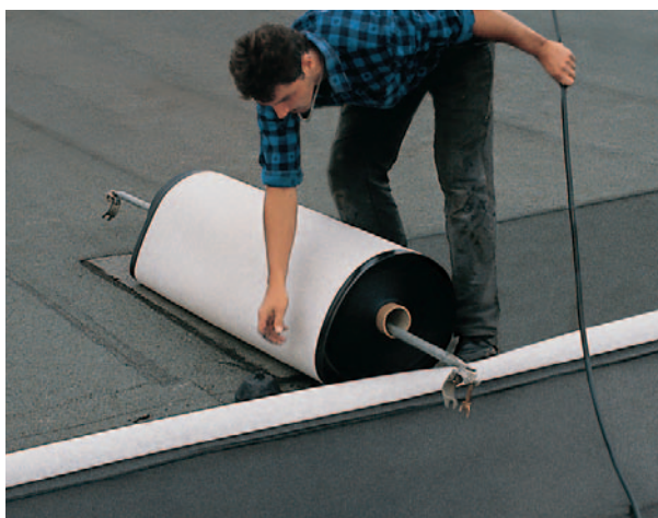
Die NOVOPROOF® Dachdichtungsbahn DA-S ist auf der Unterseite mit einer robusten Dickvlieskaschierung ausgestattet.