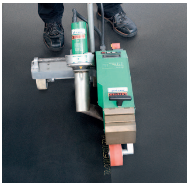
Für den Einsatz auf der Baustelle: Heißluftverschweißung mit dem Schweißautomaten.