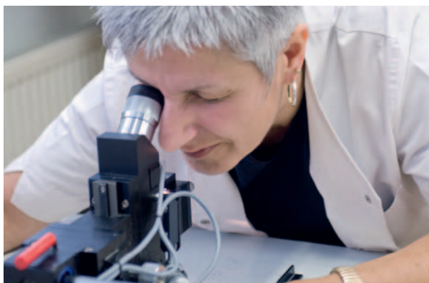
Die Qualität aller DURAPROOF Produkte wird laufend überprüft.